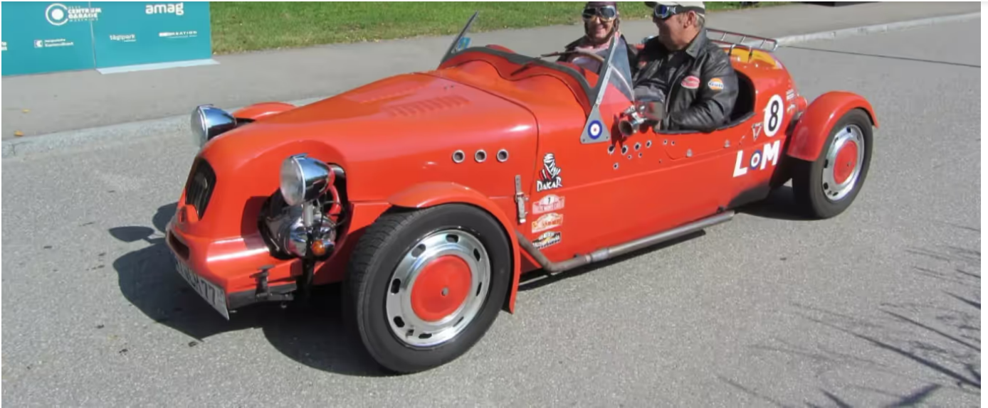
Impressionen vom Lägern Classic 2019 - Lägern Classic

Es handelt sich bei der Lägern Classic Cruise nicht um einen organisierten Corso, sondern um individuelle Fahrten. Die Teilnehmerinnen und Teilnehmer reihen sich in den normalen Strassenverkehr ein.