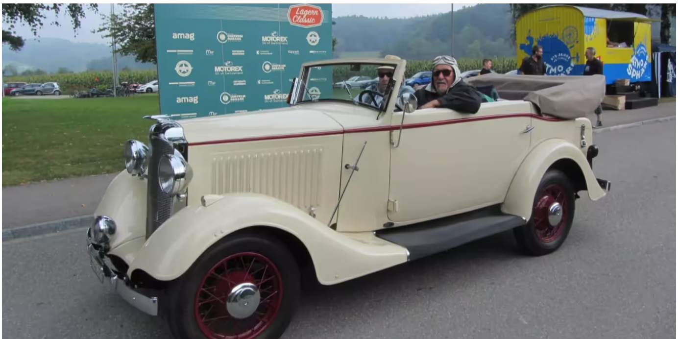
Lägern Classic: Auffahrt der Oldtimer in 2019 - Lägern Classic

Eine Fahrt von Würenlos via Oetlikon, Otelfingen, Buchs, Regensdorf, Dielsdorf, Niederweningen, Ennetbaden , Baden und Wettingen wieder zurück nach Würenlos . Oder das Ganze in umgekehrter Richtung.